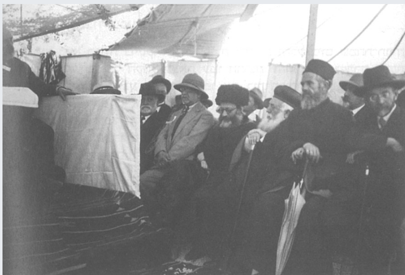
בפגישה עם חברי הקונגרס הציוני. ליד הרב קוק הראשון לציון הרב יעקב מאיר, ראשון מימין הרב יהודה לייב מימון.

אחיכם הנאמן המברככם מקודש בכל הגות רוח ונפש אברהם יצחק הכהן קוק