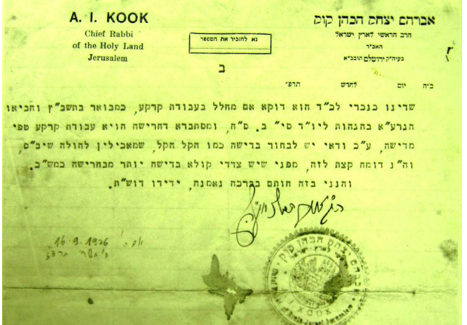
כתב היד המקורי של תשובת מרן הראי"ה אל הרס"ג טכורש זצ"ל, אשר מובאת בעלון זה [ונדפסה לימים בשו"ת 'אורח משפט' סי' קלה].

"ב"ה עה"ק ירושלים תובכ"א ח' תשרי תרפ"ז. לכ' הרב הג' מו"ה סנדר גדלי' טהורש שליט"א בחטין ת"ו שלו' וברכת גמר חתימה טובה. ע"ד שאלתו, אם יש הכרח לעשות אחת מב' מלאכות חרישה או דישה בחול המועד, מפני דבר האבד, שראוי לבחור את הקלה שבהן, מה בוחרין חרישה או דישה, יפה כתב כת"ר שהדישה היא קודמת, חוץ מהטעם שכתב שהדישה יש בה דבר האבד ממש, שאם ידרו גשמים תתקלקל התבואה בגורן, וגבי חרישה הוא רק מניעת ריוח, שאי אפשר לבא כאן מטעם דבר האבד, אלא מטעם אין לו מה יאכל, כמבואר בס"י תקמ"ב ס"ב, אבל זה ההיתר קשה לדעת המ"א דאם רק יש לו לחם ומים אינו בכלל אין לו מה יאכל, ואיני יודע אם הגיעו לכלל עניות כזאת. אמנם כדומה שבא"ר [אליה רבה] מקיל יותר בזה, אבל אינו תחת ידי כעת. וגם אם יש איזה סחורות למכור כתב הב"י שאינו בכלל אין לו מה יאכל, ואיננו יודע את המצב בפרטיות, ע"כ יותר טוב לבחור בדישה, שיש בה צד אפשרות של לצורך המועד ג"כ [...] ומ"מ יותר טוב לחקור אצל הבקאים בדבר למצא צד שינוי. עכ"פ אם יראה כת"ר שיש כאן ודאי או קרוב לודאי דבר האבד, או שאין להם מה יאכל, ראוי להתיר להם המלאכה בחוה"מ, ומאחר שהדבר שקול ואי אפשר בלא"ה להשלים את שתי המלאכות הדישה וגם החרישה, צריכים לברור את הקלה שהיא הדישה [...]. והנני בזה חותם בכרכה נאמנה ידידו דושי"ת. הק' אברהם יצחק ה"ק" [אורח משפט' אור"ח סימן קלה, עיי"ש].