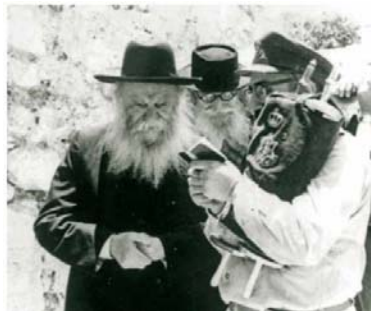
הרב שלמה גורן, הרב הנזיר דוד הכהן והרצי"ה קוק בכותל המערבי ביום שחרורו

כ"ח אב תשל"ב יום פטירת הרב הנזיר הרב דוד ב"ר יוסף הכהן (-1887) הרב נולד בעיירה סמוכה לוויילנה, בגיל 14 החל ללמוד בישיבת וולוז'ין, לאחר מכן עבר ללמוד בראדין אצל מרן החפץ חיים. הרב הנזיר ידוע היה כאיש פלאי סגפן ומקובל גדול. מחמת צדקותו קיבל על עצמו נזירות ועוד הוסיף על זה, צמחונות, תענית דיבור בכל שבת וכן מערי"ח אלול ועד אחרי יום כיפור. בהיות הרב הנזיר סטודנט בשוויץ הכיר שם את הרב קוק וכשעלה לארץ ישראל שוב התחברו והפעם נהיה לאחד מבכירי תלמידיו ובהר בו לערוך את כתביו. שנים רבות עמל הרב הנזיר על כתבי הרב קוק והוציא לאור את " אורות הקודש ", את " חזון הצמחונות והשלום " ועוד. הרב הנזיר חיבר מעט ספרים ביניהם " קול הנבואה ". עד היום ממשיכים להוציא לאור את כתביו, לדוגמה: "זכו שכנה ביניהם" ועוד רבים.