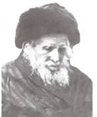
הרב שמואל סלנט

כ"ט אב תרס"ט יום פטירת הרב שמואל ב"ר צבי הירש סלנט (1816-1909) רבה המיתולוגי של ירושלים ומורה הוראה בה במשך שבעים שנה. הרב סלנט נולד בביאליסטוק (פולין) בגיל 13 הוסמך לרבנות, בשנות 20 לחייו הוא בחר לעלות לארץ ישראל. בדרכו לירושלים פגש את משה מוניטפיורי הם התיידדו מאד, ידידות שהניבה הון לבניית ירושלים בעתיד. הרב סלנט הגיע לירושלים ומצא לעצמו דירה קטנה בחצר חורבת רבי יהודה החסיד שם התגורר במשך חמישים ושתים שנים. עם עלותו מונה לאב"ד בביה"ד האשכנזי. בהמשך יסד בחצר ביהכ"נ החורבה את התלמוד תורה והשיבה עץ חיים - בבת עינו במשך כל חייו.