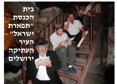
בית הכנסת "תפארת ישראל" העיר העתיקה ירושלים

אם יש ברית מילה, מלים אחר הקינות. המוהל והסנדק, האב והאם, לובשים בגדים מגוהצים עד אחרי המילה. נותנים הכוס לקטן לשתות, ואסור לאכול עד הלילה. הולכים ביום זה כנזופין, ואין שואלים בשלום כשפוגשים חבר. עם הארץ השואל - משיבים לו בשפה רפה. לא לומדים תורה, משום שנאמר "פקודי ה' משמחי לב", חוץ מדברים השייכים לאבילות היום. עד חצי היום אין עושים מלאכה, ואין יושבים על הספסל. חליצת הנעלים היא מחמשת העינויים, ונוהגת כל היום (ויש המקילים בזה אחה"צ, וראוי להעיר להם).