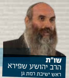
שו"ת הרב יהושע שפירא ראש ישיבת רמת גן

פגעתי בחבר שלי והוא לא מוכן לסלוח לי. ניסיתי לפייס ללא הצלחה, אני מרגיש שבור!