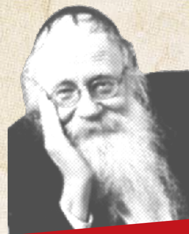
הרב עדין אבן ישראל (שטיינזלץ)

ההשקה היא בירושלים דווקא, משום שבירושלים יש נקודת שבר, שבה השמים והארץ אינם מרובדים נראוי. במקום שהשמים יהיו למעלה והארץ למטה, כמו בכל מקום אחר, בירושלים השמים של כל העולם נוגעים ונמצאים באותו מישור בו נמצאת הארץ. זוהי הסיבה לקדושתה המיוחדת של ירושלים, להיותה ה"מקום אשר יבחר ה'", מקומו של בית המקדש. לב לבו של השבר הזה, הנושא בתוכו את ההבדל הנורא, הגדול, שבין שמים לארץ, מתגלה בקדוש הקדשים. קודש הקדשים, כפי המתואר בדברי חז"ל, הוא מקום שאינו מן המידה - "מקום ארון וכתובים אינו מן המידה" - הוא איננו שייך לגדרים ולמידות של העולם הנורמלי. בבית המקדש העולם העליון צומח בשווה עם העולם התחתון, משום שזוהי ירושלים, המקום אשר יבחר ה'. קודש הקדשים הוא כאמור, מרכזו של השבר הזה, ומסביב לו שוכנת העיר, שכן קו השבר הזה הוא מעגלי. ישנו המעגל של המקדש, והמעגל של הר הבית, והמעגל של כל העיר, ולבסוף המעגל של ארץ ישראל כולה - וכולם