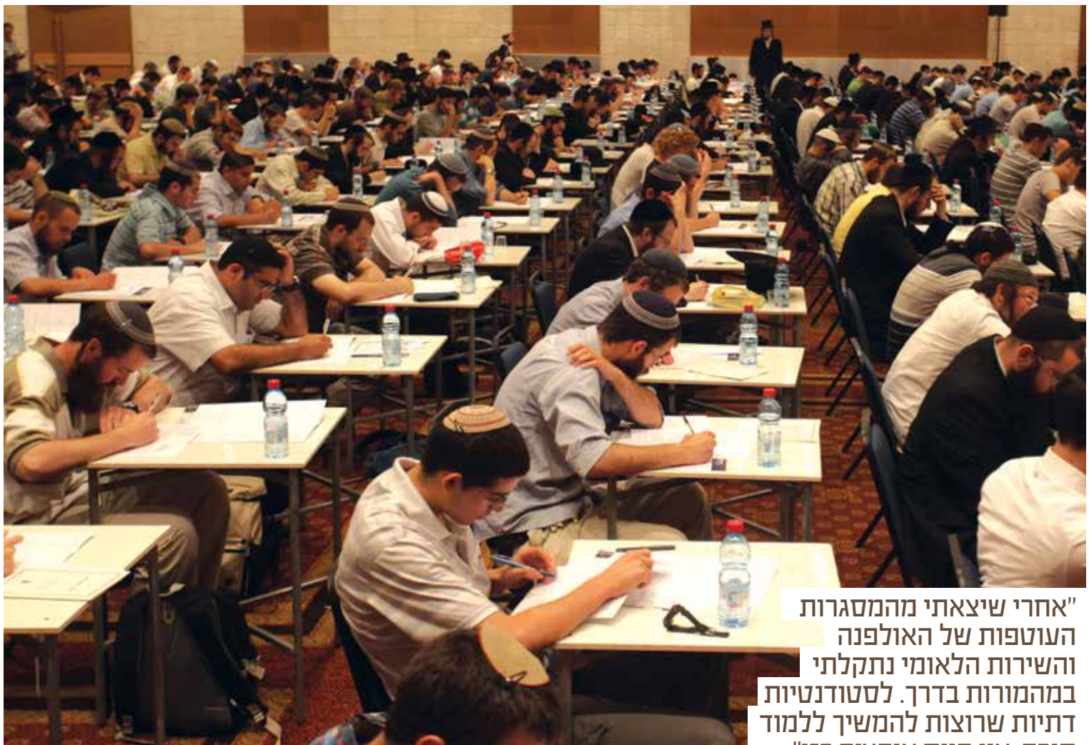
"אחרי שיצאתי מהמסגרות העוטפות של האולפנה והשירות הלאומי נתקלתי במהמורות בדרך. לסטודנטיות דתיות שרוצות להמשיך ללמוד תורה, אין היום אופציה כזו"