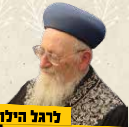
לרגל הילולת הרב מרדכי אליהו זצ"ל