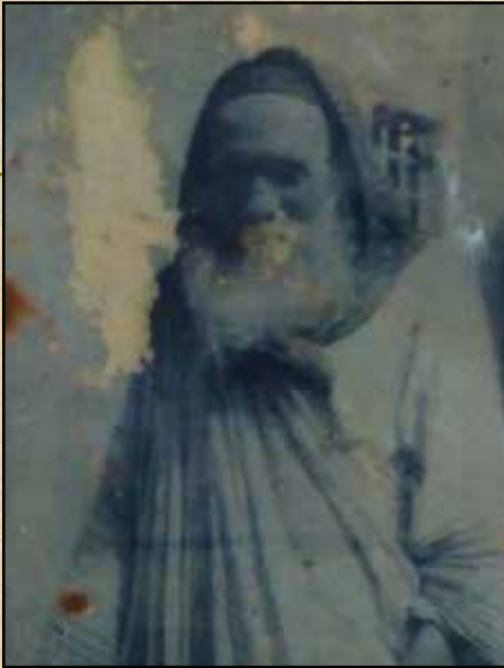
תמונת רבו של הבבא סאלי. סרט הציילום נשרף שוב ושוב עד שביקשו ממנו רשות

אתה שואל מה משמח אותי? מאז שגיליתי את הגמרא של שוטנשטיין החיים שלי התהפכו... לטובה כמוכן!