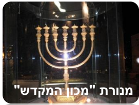
מנורת "מכון המקדש"