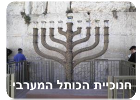
חנוכיית הכותל המערבי