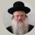
ליקוטי מוהר"ן הרב שמעון טייכנר מרבני סגולתה