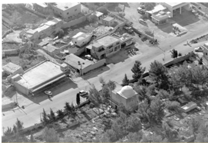
קבר רחל במבט מהאוויר

בואו של הפרש הבודד עורר תדהמה והערצה בקרב יהודי ירושלים. עוז רוחו וכישרונו הביאו למינויו לנאמן על נכסי הציבור ושמירתם. שמעו הגיע גם למשה מונטיפיורי, שראה בו כראוי ביותר לשמש כאחראי על מקום הקבר, תפקיד שדרש אומץ לב