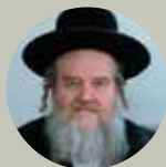
קוצק ופשיסחא הרב ישראל יצחק מנדלסון גאב"ד קוממיות ירושלים