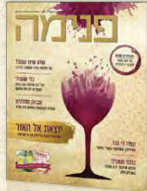
מגזין חגיגי ומיוחד