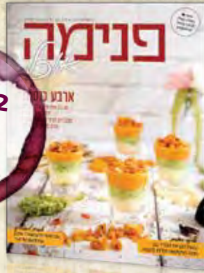
שלל מתכונים ייחודיים