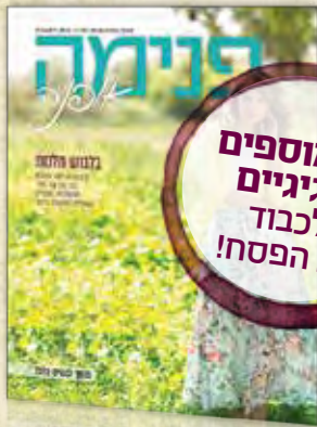
בתי האופנה המובילים במגזר