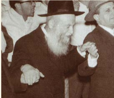
הרצי”ה בחגיגות יום העצמאות

• ובשנת ה'תשכ"ז היא השנה הגדולה לגאולת עיר הקודש ירושלים, שנה בה נשמעה הקריאה הגדולה של מזמור י"ט למדינת ישראל, השנה ההיא בה נקרע האויר מקול זעקתו הגדולה של רבנו, בציטוט דברי הנביא יואל 'זאת