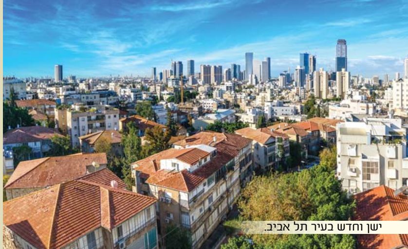
ישן וחדש בעיר תל אביב.

שהוקבע ליו"ט אין ברכתו רשות אלא חובה. ונכון להסמיך ברכת שהחיינו לאמירת הלל, היינו לפני ברכת הלל אם אומרים את ההלל בברכה או לפני התחלת אמירת הלל אם אומרים הלל בלא ברכה".