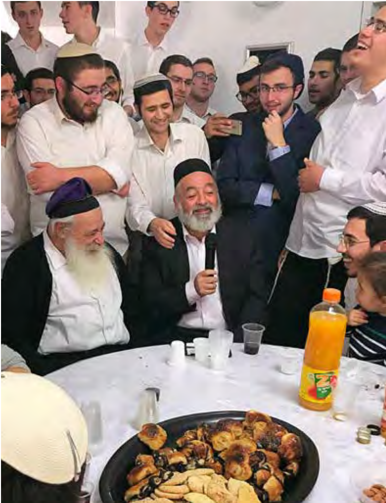
עם תלמידים בשמחת פורים