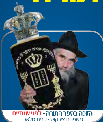
הזוכה בספר התורה - לפני שנתיים משפחת צירקוס - קרית מלאכי