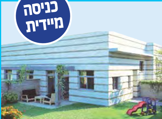
*ההדמיה להמחשה בלבד