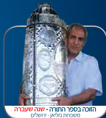
הזוכה בספר התורה - שנה שעברה משפחת גזילאן - ירושלים