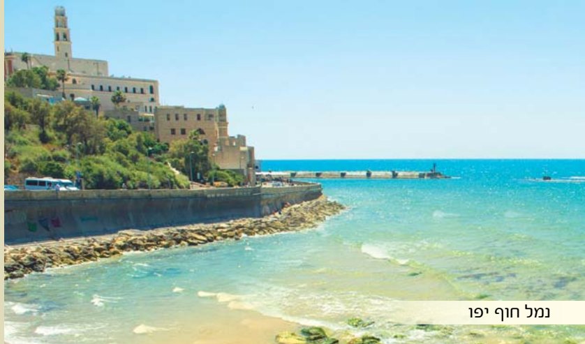
נמל חוף יפו