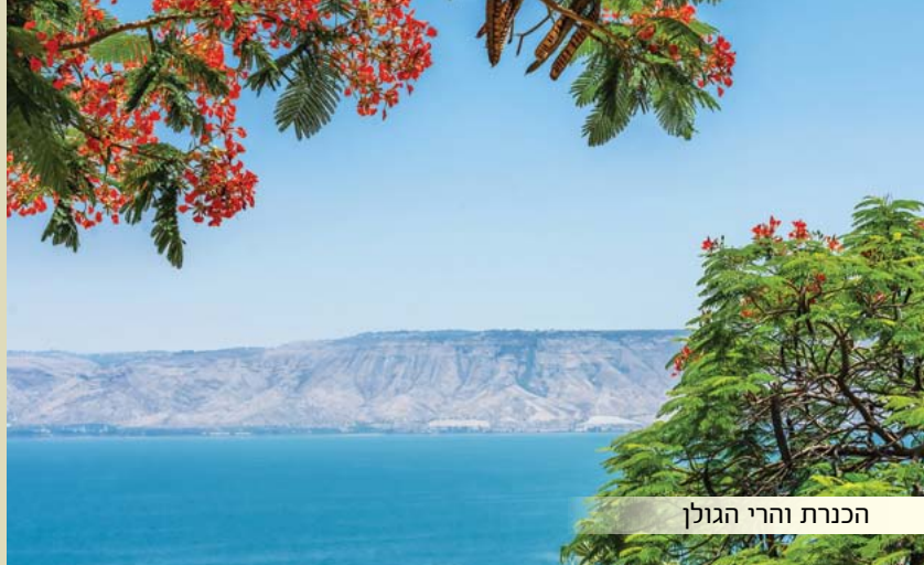
הכנרת והרי הגולן

חמישה רבדים הללו הם גילויים מהנשמה, שהיא כעין השמש שיוצאים ממנה קרני שמש וכל רובד מבטא ואחראי על ביטוי רוחני אחר.