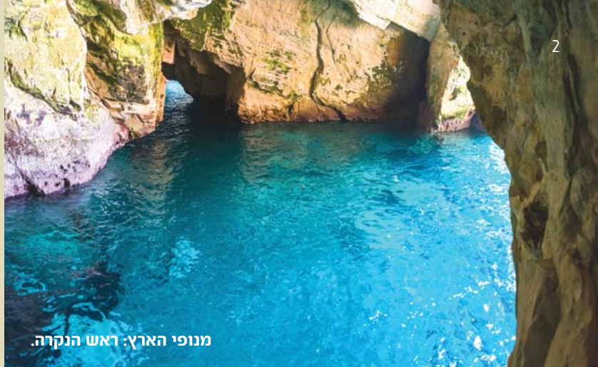
מנופי הארץ: ראש הנקרה.

חכמת הקודש היא פועלת יוצרת, היא מרוממת את לומדיה לגובה הנשמתי אשר משם נחצבו דברי התורה.