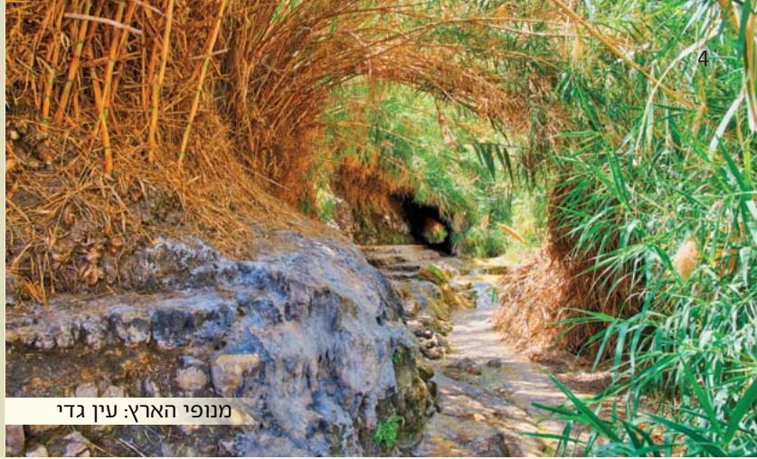
מנופי הארץ: עין גדי