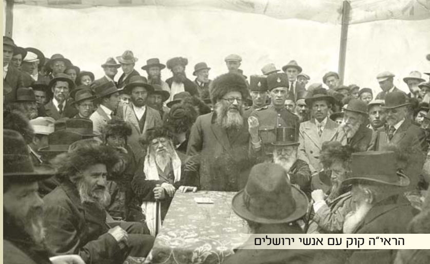
הראי"ה קוק עם אנשי ירושלים

העולם היהודי, לארצותיו ברחבי אירופה, חווה את האווירה הטעונה ומתחילה ממנו נהירה והגירה מאסיבית מערבה, ובמיוחד ל'ארץ האפשרויות הבלתי מוגבלות' - לאמריקה!