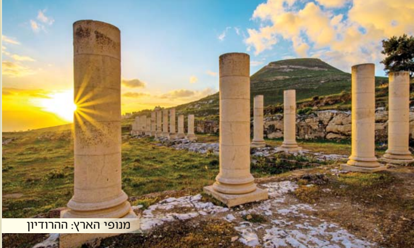
מנופי הארץ: ההרודיון

קדושה - הקדושה המתגלה משורשה בעולם העליון נמשכת אל העולם הזה, מופיעה מתוך ההכרה של אחדות ד' ואחדות ההויה, הקדושה מאירה את העולם בכל ערכי החיים.