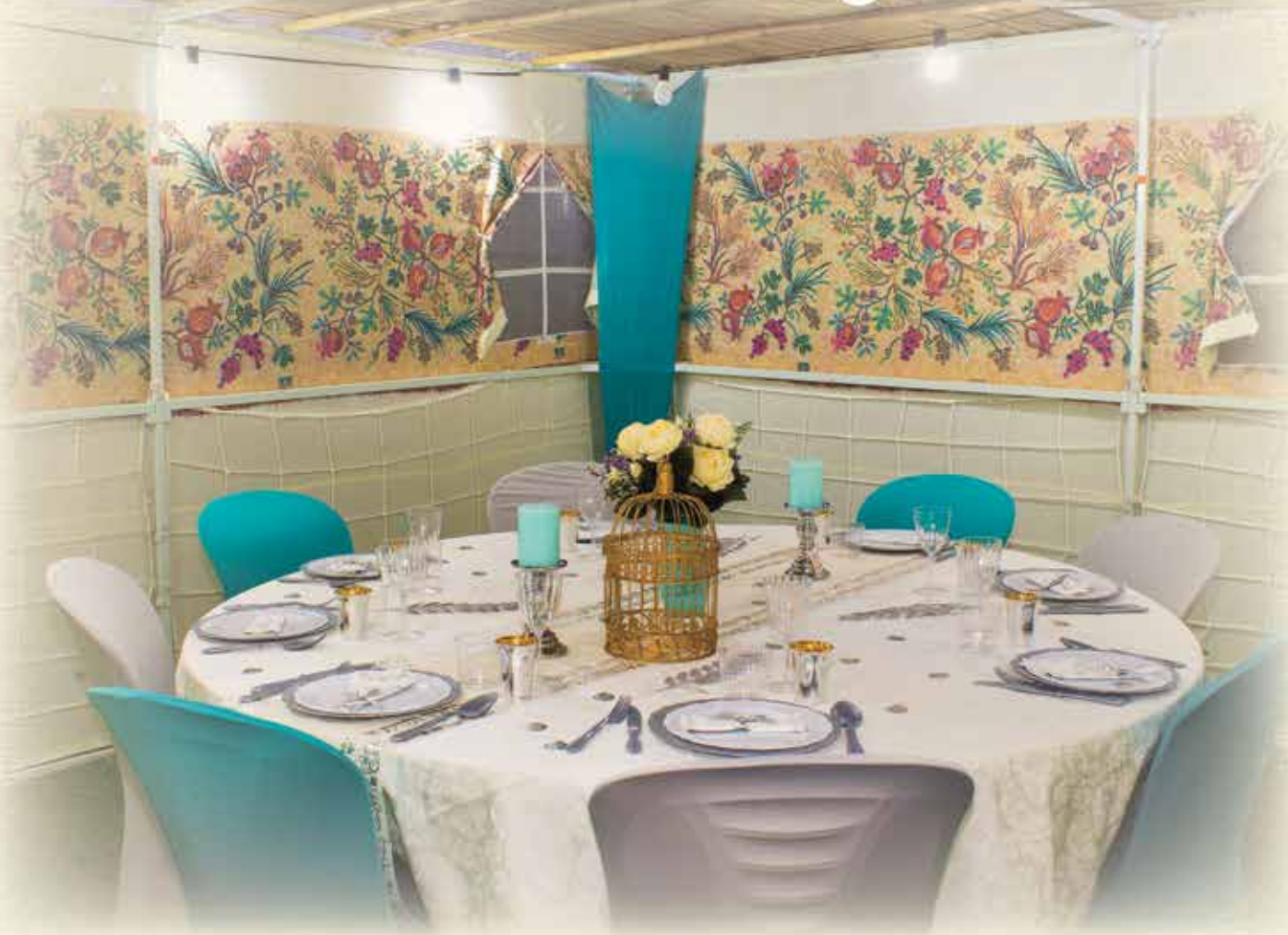
תצוגה מרהיבה, במחסן הראשי: מושב ברכיה, ליד אשקלון