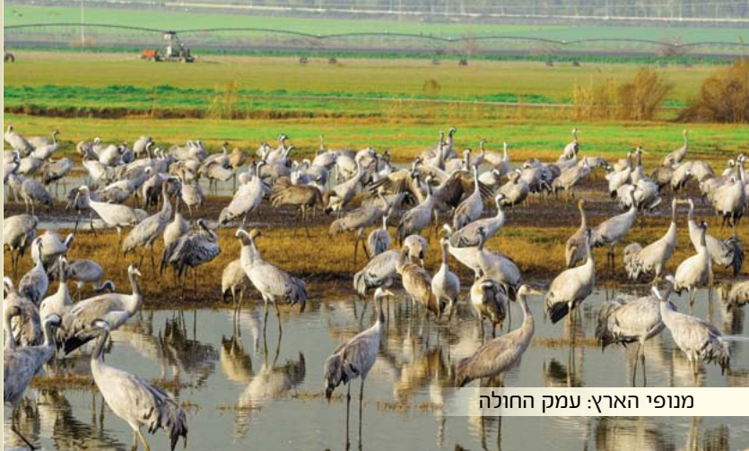
מנופי הארץ: עמק החולה

מִרְן הָרַב זַצ"ל (בכמה מ'מאמרי הראיה) מְבַאֵר אֶת מֵהוּת הָאֲמוּנָה: