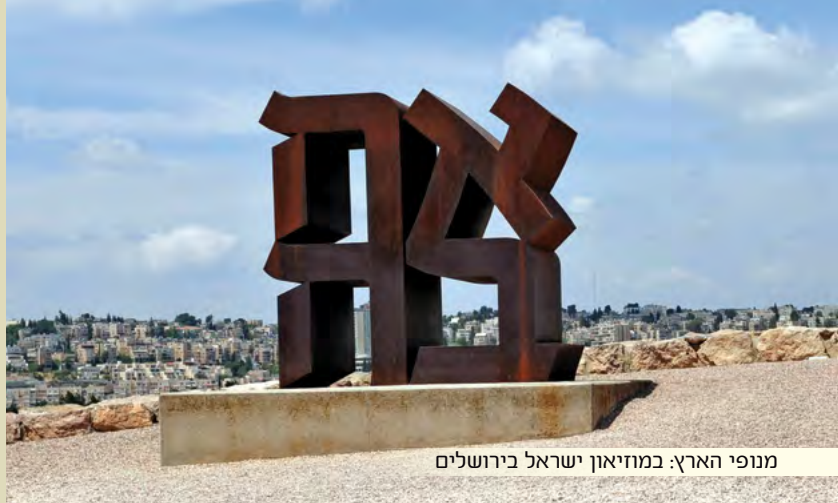
מנופי הארץ: במוזיאון ישראל בירושלים

כאשר נתבונן באומות בכלל ובאומה הישראלית בפרט, נמצא מעגלים נוספים של גילויי הנפש הפרטיים והכלליים, הקודש "הדת", הלאומיות , והליברלי הכלל אנושי.