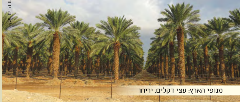
מנפי הארץ: עצי דקלים, יריחו