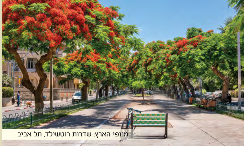
מנופי הארץ: שדרות רוטשילד, תל אביב

את דגל תקנות האמה וחפץ תחיתה, את חותם אהבת ארץ אשר עיני ד' בה, וחבת ציון וירושלים על לבו חקוקה, באיזו צורה ואיזו הסברה שתהיה.