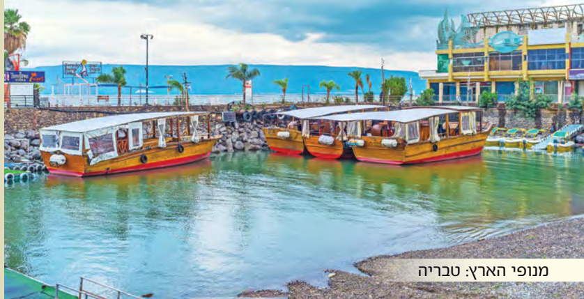
מנופי הארץ: טבריה