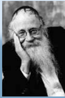
הרב עדין אבן ישראל (שטיינדלץ)

אחד מרבותיי סיפר לי כי לאחר שמסר את נפשו על קידוש ה' וניצל, הוא הרגיש את הארת הנשמה במשך מספר שבועות. התפילה והתורה שלו היו לגמרי אחרת