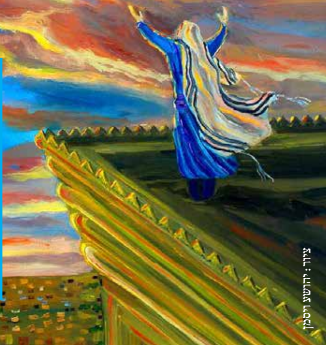
ציור: יהושע ויסמן

הרבה מים זרמו בירדן מאז ביקורו של החסיד בטבריה לפני שבעים שנה. המון דברים השתנו, אבל זיכרון אחד נצרב ונשאר < בכל שבת בבוקר היה הריי"צ מתפלל עם אותו ניגון, אך בכל שבת מחדש הוא לא הצליח לשיר אותו עד לסיומו... > אחד מרבני הישיבה לא יכול היה לסבול את תופעת המתפללים באריכות על חשבון לימוד הגמרא, והוא קם ונסע לרבי. מה הייתה תגובתו?