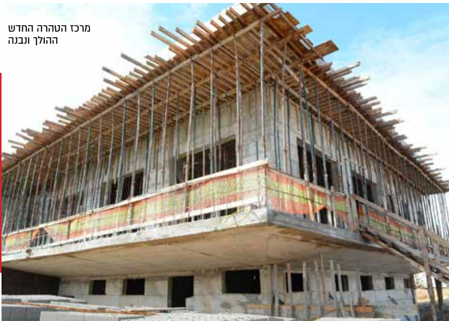
מרכז הטהרה החדש ההולך ונבנה

הרב הבלין: "הנכונות להתעסק גם בדברים הקטנים שאינם מושכי כותרות היא מה שהופכת את העיר לכזאת שרק צומחת והולכת. כאחד שמתבונן עליה מבחוץ, אבל נמצא בה הרבה, זה מרשים כל פעם מחדש”.