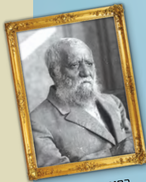
הסופר אלכסנדר ז'סקינד רבינוביץ'