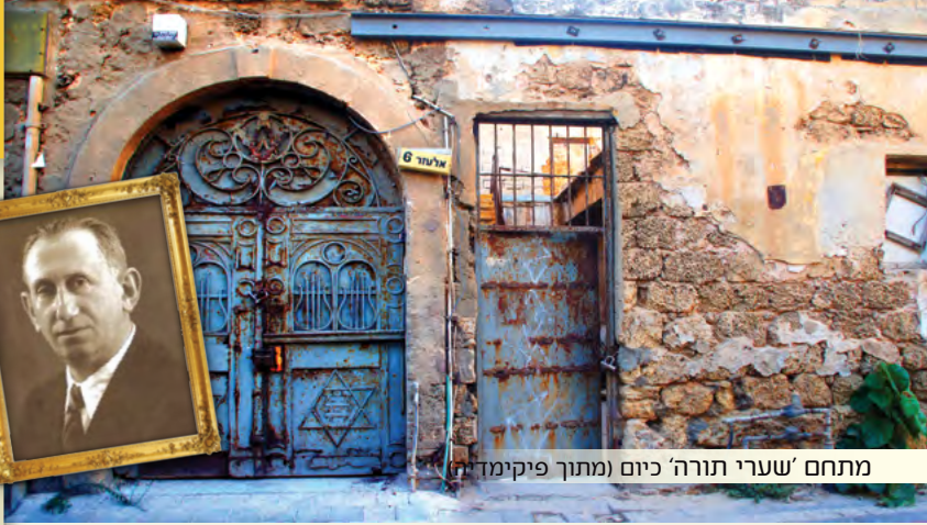
מתחם 'שערי תורה' כיום (מתוך פיקודת

על תולדות הת"ת ובית המלאכה נכתבו פרקים מספר; אך בשורות אלו בכוונתנו להאיר ולתת את הדעת דווקא על הספר "הלב הטוב שיצק