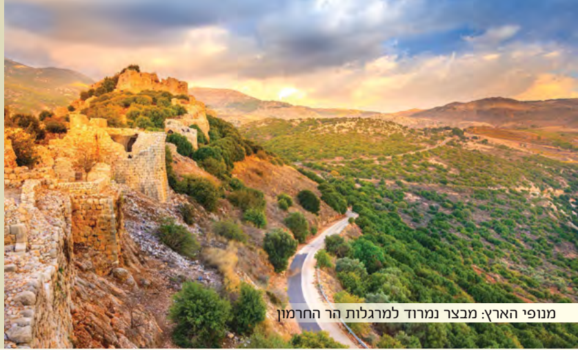
מנפי הארץ: מבצר נמרוד למרגלות הר החרמון