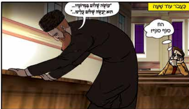
בְּעֵבֶר עוֹד שְׁעָה

"עוֹשֶׂה שְׁלוֹם בְּקִרְוֵי... הוּא יַעֲשֶׂה שְׁלוֹם עֲלֵינוּ..."