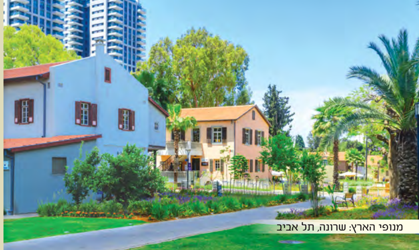
מונפי הארץ: שרונה, תל אביב