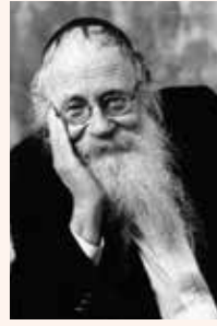
הרב עדין אבן ישראל (שטיינזנץ)