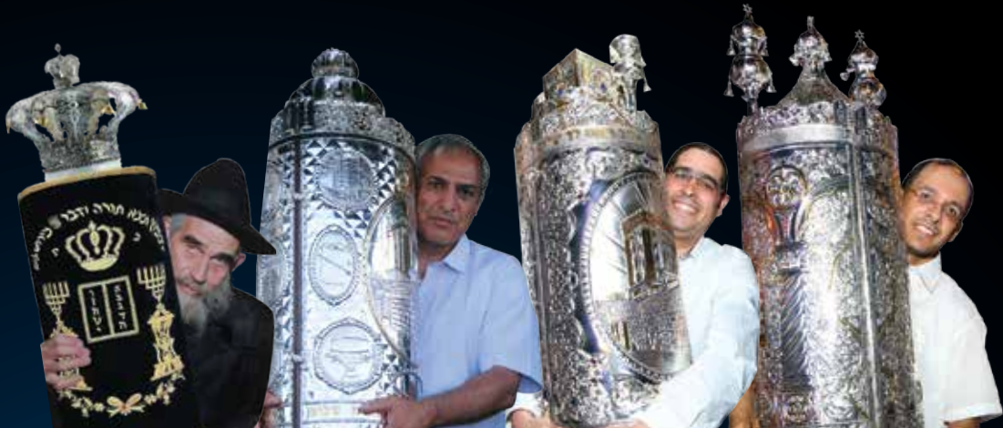
משפחת צירקוס - קרית מלאכי