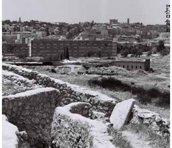
"לא ידענו מה הולך להיות בירושלים". גבעת התחמושת לאחר הקרב

18:00 מפגינה לצמיחה: מעגלי שיתוף וסיפורים אישיים