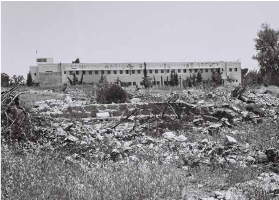
מסביב היה קונצרט של יריות, אבל הם לא התרשמו. גבעת התחמושת