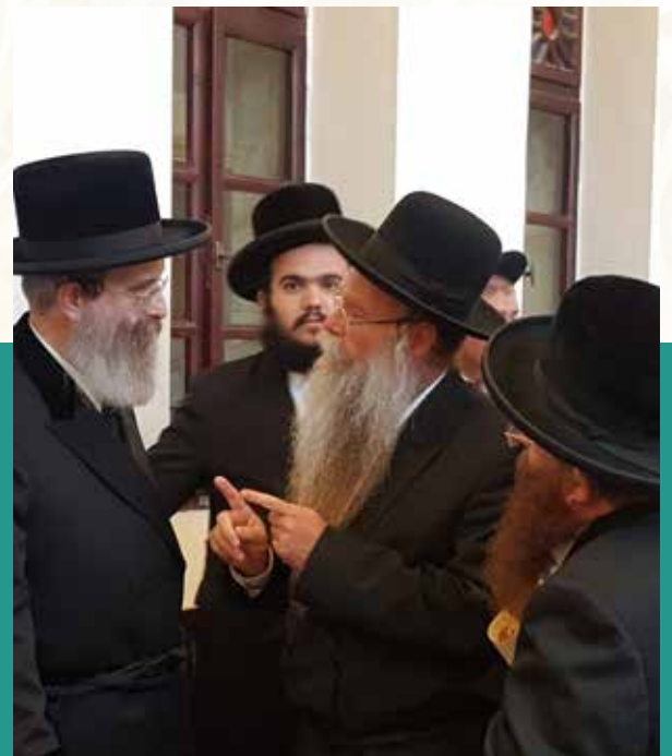
עם האדמו"ר מסדיגורא