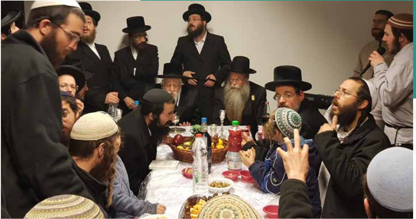
טיש ט'ו בשבט בקבר יוסף הצדיק עם האדמו"ר מקופשיניץ