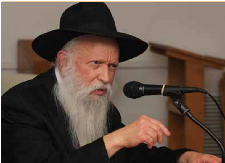
הרב יצחק גינזבורג