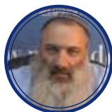
הרב דוד שלם