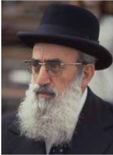
הרב הראשי לישראל הרב שלמה גורן זצ"ל (תרע"ח-תשנ"ה)