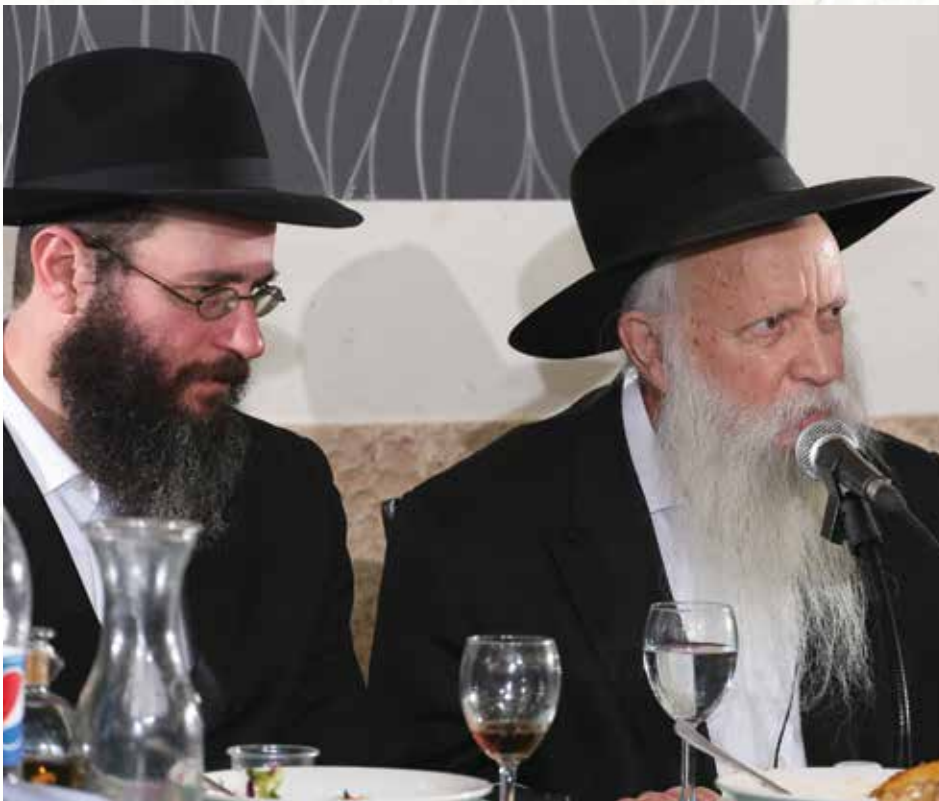
יכולת מדהימה לחוש בדקויות הפסיכולוגיות ושלטיה בלתי רגילה במערכת הסמלית-הקבלית. מנוסי עם הרב יצחק גינזבורג

לעשות. אבל אני מסכים - זו אכן מציאות דיכוטומית מדי וזקוקה לאיזון. הגברים צריכים ללמוד תורה גם בצורה יותר נפשית ו'נשית', ואת הנשים שלומדות חסידות אני מעודד ללמוד גם בצורה שכלתנית - לא להסתפק ב'וורטים' קטנים וקלים לעיכול, אלא ללמוד ברצינות מתוך התבוננות והקשבה עמוקה לטקסטים. הבשלות של שני המינים מגיעה ממה שנקרא 'התכללות' - כשיש צד נשי מפותח בגבר וצד גברי מפותח באישה, רק לא על חשבון החיבור הבסיסי למגדר שלהם."