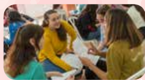
גם בקודש ובחברותות