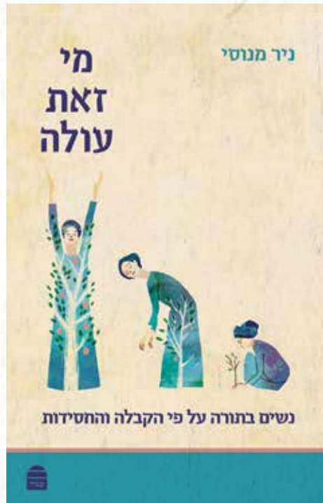
שער הספר החדש

הלימוד: תמיד מאפיינים את אהרן הכהן בתור מי שהיה משכין שלום 'בין אדם לחברו ובין איש לאשתו'. המדרש מתאר איך הוא היה ניגש לחבר הראשון, מרצה אותו ואז הולך לחבר השני, וכך הם היו