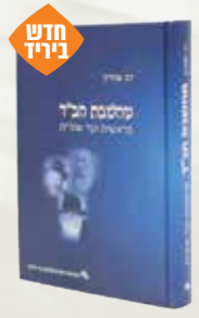
מחשבת חב"ד דב שוורץ