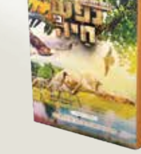
נפש חיה - עופות מנחם הרשקוביץ'