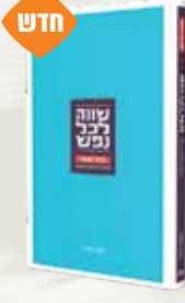
שווה לכל נפש - פרקי אבות משה שילת