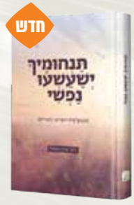
תנחומין ישעשעו נפשי - לוגותרפיה יהודית-חסידית הרב ארלה הראל