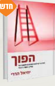
הפוך יחיאל הררי