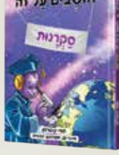
חושבים על זה סקרנות תמי קופרמן