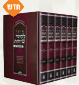
אוצר לקוטי שיחות עם ביאורים הרבי מליובאוויטש