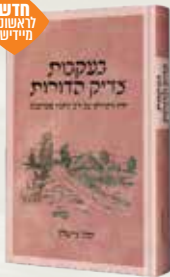
בעקבות צדיק הדורות הרב הלל צייטלין