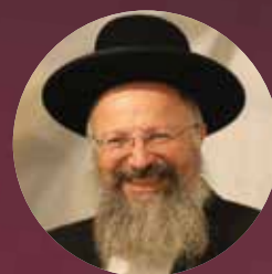
הרב שמואל אליהו שליט"א רב העיר צפת