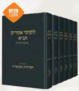
תניא עם פירוש חסידות מבוארת רבי שניאור זלמן מלאדי