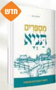
מספרים תניא מנדי קרומבי