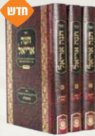
חנה אריאל רבי אייזיק מהמיל