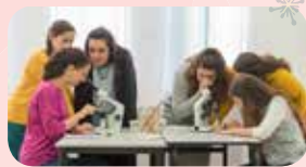
גם במצוינות הלימודית