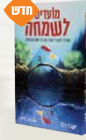
מועדים לשמחה משה רט ואליהו טייב