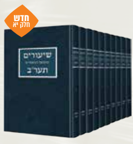
שיעורים בתער"ב הרב יצחק ערד