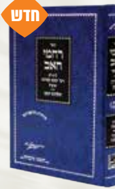
רחמי האב רבי יעקב קטינא