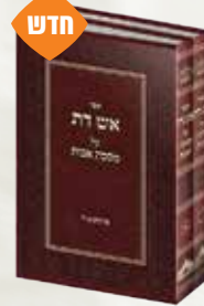
אש דת על פרקי אבות רבי אריה לייב מאוז'רוב