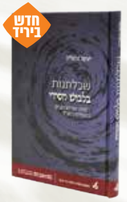
שכלתנות בלבוש חסידי יעקב גוטליב