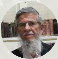
הרב יצחק שילת שליט"א מופע חצות