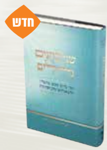
שני כהנים גדולים הרב חיים ישעיהו הדרי