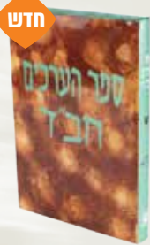
ספר הערכים - אחדות ה' הרב יואל כהן