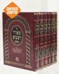
מאור ושמש רבי קלונימוס הלוי אפשטיין

מגוון ספרי חסידות במחירים מיוחדים היריד שהפך לסמל של י"ט בסלו לא מפסיק לחדש ולהתחדש, עם מאות ספרים חדשים ממיטב ההוצאות, מבצעים חדשים והרבה יותר אפשרויות.