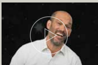
// יונתן רזאל "כי כל פה לך יודה"