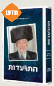
התועודות הרב חיים שלום דייטש