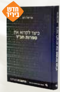
כיצד לקרוא את ספרות חב"ד אריאל רוט