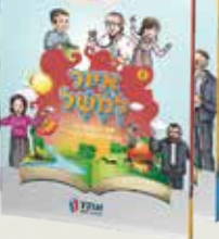
איור למשל משלים חסידיים בקומיקס