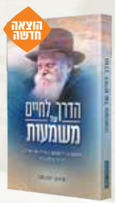
הדרך לחיים של משמעות הרב סימון יעקובסון