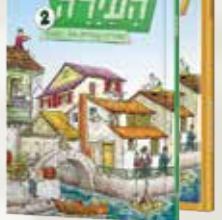
העירדה לוי גרונר