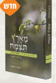
מארץ תצמח - על 'השפת אמת' דניאל אלאוף