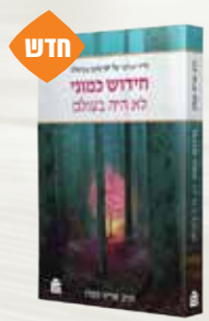
חידוש כמוני הרב אריה קפלן