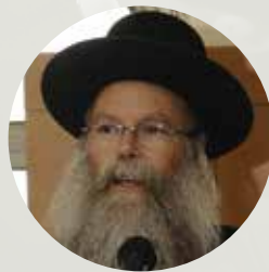
הרב דוד דודקביץ שליט"א כנס החסידות