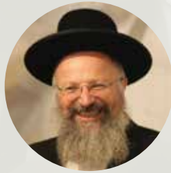
הרב שמואל אליהו שליט"א נוער בנות ומופע חצות