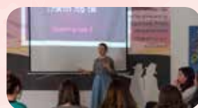
גם בפיתוח כישורים אישיים

את מכירה אותה, מרגישה אותה עמוק בפנים. יש לך אישיות גדולה שמחכה לפרוץ ולצמוח.