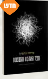
ספר האהבה והשיגעון מרדכי גרנביץ'