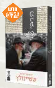
הרבי שלי הרב עדין אבן ישראל (שטיינזלץ)