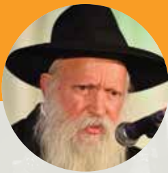
הרב יצחק גינזבורג שליט"א התוועדות יום שלישי