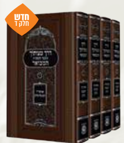
דרך מצותיך המבואר הרב יצחק צדק