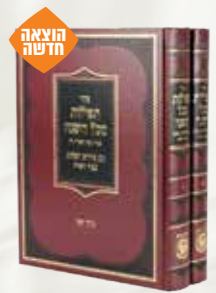
ספר סידור עם דא"ח רבי שניאור זלמן מלאדי