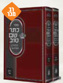
כתר שם טוב המבואר רבי ישראל בעל שם טוב