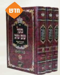
בעל שם טוב המבואר רבי ישראל בעל שם טוב