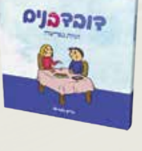
דובדבנים - זוגיות לאור פרשת שבוע אריק מלכיאלי