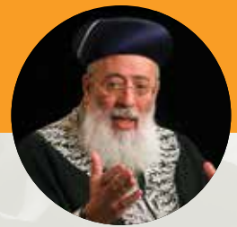
הרב שלמה עמאר שליט"א נוער בנים