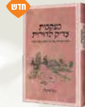
בעקבות צדיק הדורות