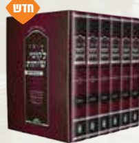
אוצר לקוטי שיחות עם ביאור, י' נרכים