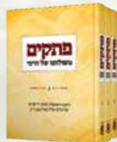
פתקים משולחני של הרבי