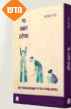
מי זאת עולה