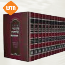
אוצר לקוטי שיחות עם ביאור בלכתך בדרך, י"ב נרכים