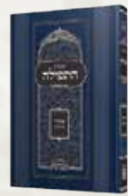
קונטרס התפילה עם ביאור