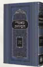
מאמרי אדמו"ר הרי"צ עם ביאור