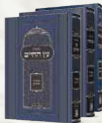
מארז ספרי: קונטרס התפילה, קונטרס העבודה, קונטרס עץ החיים עם ביאור