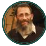
הרב אלישע אבינר