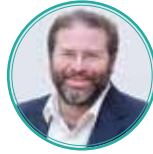
הרב חגי לונדין ארגון 'קהלים'