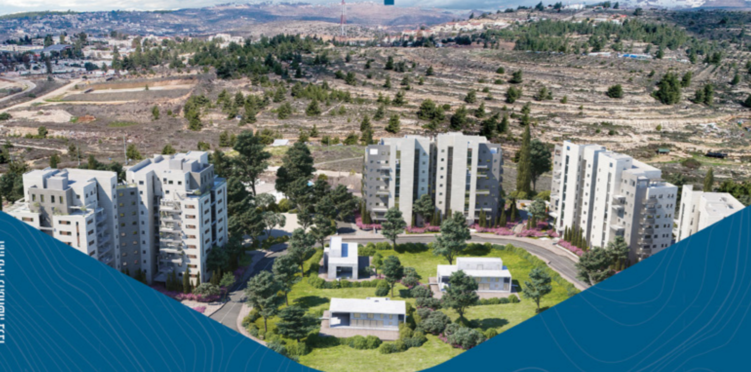
הדמייה להמחשה בלבד