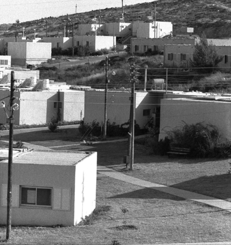
מגדל עז בגוש עציון, נבנה על חורבות מגדל עדר.

אליהו שלמה הי"ד: "אחי יקירי שמעתי אשר הפרנסה אצלך עוד איננה בסדר, וירא אנכי שלא יעלה בלבך שום רושם ומחשבת חרטה על מה שעלית לארץ ישראל, הן אמת שיועד אני כן ומכיר אני אותך שרצונך והחלטתך עזה וחס ושלום לא תתחרט ולא היית ולא תהיה מאותן שיש להם חרטה על מעשיהם הטובים, אבל לחזק אותך באתי תחזקנה יריך כי רבות עשית וכמו שאמר בעז לרות כשעזבה את ארץ מולדתה ותלך אל אשר לא ידעה תמול שלשום, גם אתה עזבת ארץ מולדתך ופרנסה שהיה לך ומכרת הכל בזול כדי לעלות לארץ ישראל...".