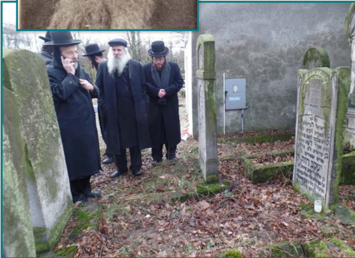
תפילה על הקורונה בשבוע שעבר

מטעו', כאשר הוא משלב בהם את דברי תורתו והסכמותיהם של גאוני דורו.