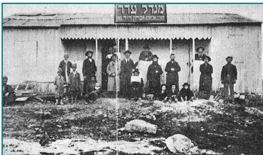
ראשוני המתיישבים במגדל עדר

מסמכים שנחשפו לפני שנה בגנזך המדינה מעלים שמדובר היה