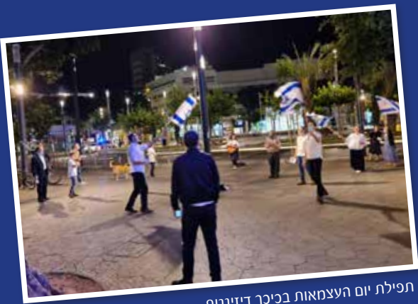
תפילת יום העצמאות בכיכר דיזינגוף

לפרטים: 02-6791122 052-5665005 www.roshy.org