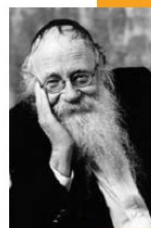
הרב עדין אבן ישראל (שמינדלץ)