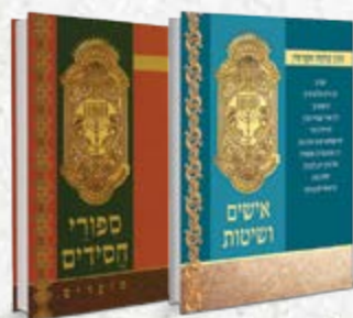
ספרי הרב זווין

עיונים בפרשיות השבוע, מדרשים, שירים וציולנים מרהיבים מעפי ארץ ישראל