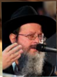
הרב שבתאי סלנטצקי, שליח חב"ד באנטוורפן