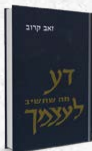
דע מה שתשיב לעצמך הרב זאב קרוב