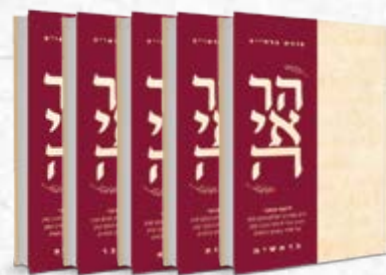
חומש הראי"ה | 5 כרכים

אלי שיינפלד התמודדות רוחנית ועצות מעשיות מתוך גישה נכונה לנושא היצר