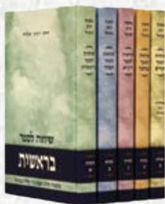
שיחות הרב נבנצל הרב יוסף אליהו

מגילת השואה והתקומה | מגילת הגבורה במלחמת יום הכיפורים | מגילת ששת הימים | מגילת המרד והחורבן | מגילת חטכה | מגילת התקומה והעצמאות