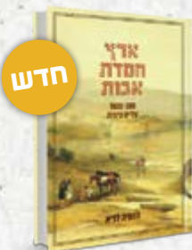
חדש ארץ חמדת אבות הרב נחמיה לביא 800 שנות עלייה ציונית