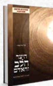
היצר הלב והאדם

אלי שיינפלד התמודדות רוחנית ועצות מעשיות מתוך גישה נכונה לנושא היצר