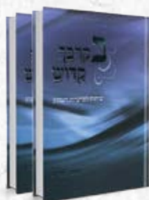
בקרבך קדוש | אי-ב'

סיפורי חסידים | אישים ושיטות | לאור ההלכה לתורה ולמועדים | המועדים בהלכה