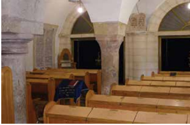
בית הכנסת הרמב"ן בירושלים.

באחת הפעמים הגעתי לאשקלון ודיברתי על גירוש ספרד, ואחת המורות אמרה לי: 'את מבינה מה בעצם קורה פה? בעקבות גירוש ספרד רבי יוסף קארו מגיע לארץ!'. נפל לה האסימון שכל המהלך של הגירוש מספרד, שהייתה המרכז היהודי הגדול באותה תקופה, לכיוון דרום אל יוון, סלוניקי וטורקיה, נועד לקרב אותנו בחזרה אל הארץ.