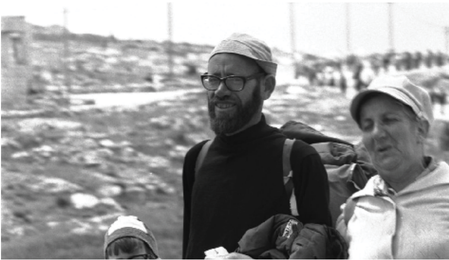
הרב והרבנית בתקופה הראשונה בחברון.

בחברון ולבקש מהם בלון חמצן עבור הילד. החיילים שבו בלי בלון חמצן ובפיהם תשובת מנהל בית החולים שגם להם אין בלון חמצן. המצב של הילד היה חמור ומרים לא היססה, היא אמרה: 'תביאו לי שני חיילים שיבואו איתי לבית החולים עם נשקים שלופים וכך 'יבקשו' את בלון החמצן, כי לפי אמנת ז'נבה בית החולים מחוייב להעניק עזרה רפואית גם לאויבים'. כך באומץ ליבה ובפשטות היא הלכה למרכז העיר העירונית עם ג'יפ צבאי, ולמרבה ההפתעה נמצא לפתע בלון חמצן."