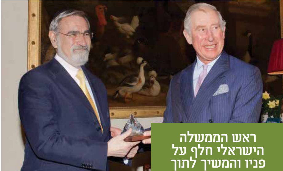
הרב עם הנסיך צ'ארלס