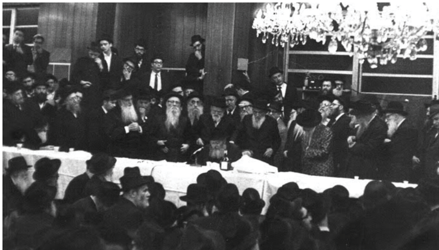
כל הפושט יד נותנים לו. התוועדות פורים עם הרבי

לעומת ההיסוס בפורים תשס"ו, הרי שבפורים תשכ"ו אף אחד כבר לא היה מוכן לפספס. בסיום ההתוועדות הרבי פתאום אמר: "כל הפושט יד נותנים לו...", והחל למזוג יין לסובכים. מיד התחילו מאות המשתתפים לרוץ