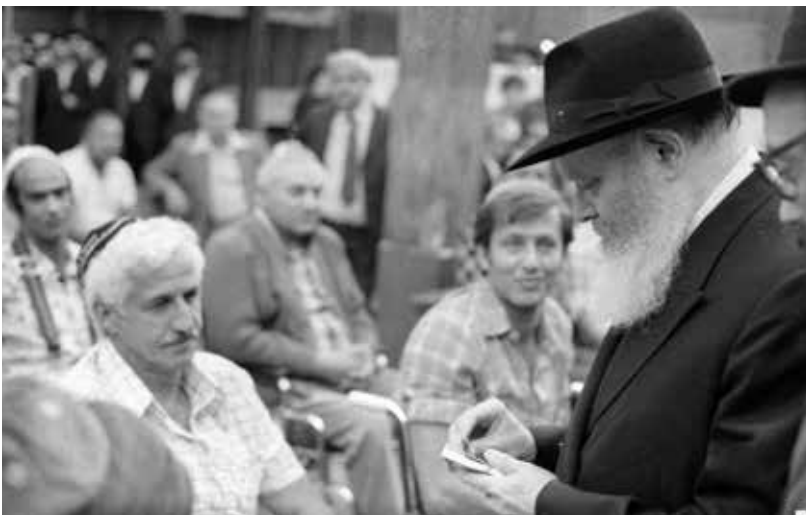
הרבי מליובאוויטש עם 'מציוני צה"ל'

ניתן להוסיף ולפרש ש"הביאני המלך חדריו" מתייחס גם לחדרי הנפש אליהם אנו זוכים להיכנס במהלך המסע. שמחת הרעיה היא האפשרות שלה לתקן ולהתקרב אל מהותה הפנימית מתוך החיבור לספירות האלוקיות.