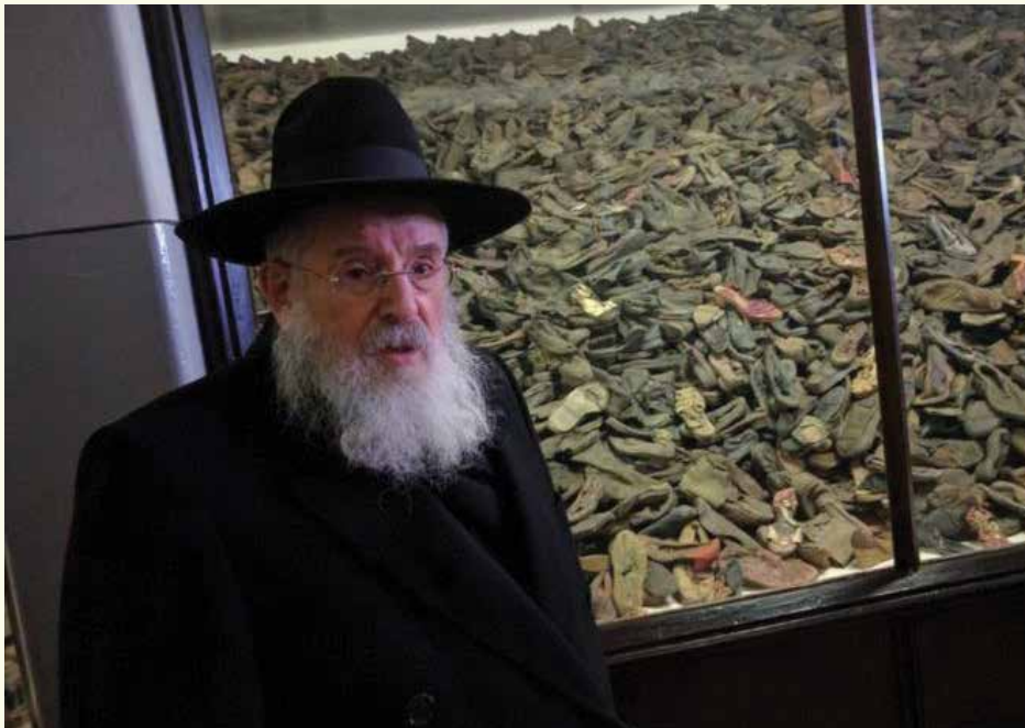
אמא לא נטשה. הרב מנגל בביקור באושוויץ

עבדנו בשמחה ובמרץ ביום שלמחרת. עד עצם היום זה אני חושב לעצמי: יחד עמי היו קרוב ל-1,200 איש בצריף. רבים מהם הגדירו עצמם כיהודים לא מאמינים, אבל איש מהם לא ביקש שנפסיק בחגיגה שלנו, למרות שסיכנו את חייו. כל אחד הסתכן, תרם את חלקו ושילם מחיר שעלול היה לעלות בחייו. למרות הכאב והזוועות שחווינו, לראשונה מזה ימים רבים חשנו שהנשמה שלנו משוחררת באמת."