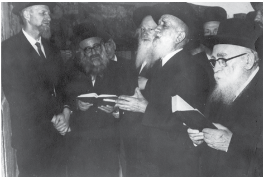
בכותל המערבי עם הרב הראשי לישראל הרב איסר אונטרמן, לאחר כנס רבנים למניעת פגיעה בבתי עלמין באירופה, ה' אייר תשל"א

את הצהרת בלפור ראה כהצהרת כורש בשעתו, ולימים ראה את הקמת המדינה היהודית בארץ ישראל כתהליך היסטורי בעל משמעות כבירה, רבות הגה ועסק בטיבו של קץ הגלות אותה מביעה תקופתנו. כך למשל כתב לאחר מלחמת ששת הימים: "עין בעין ראינו כי ה' איש מלחמה והוא יצא לפני חיילי ישראל להגן על עמו ועל ערי אלוקיננו. הבה נטה אוזן לשמוע הד קול דברי אלוקים חיים מהגאולה והתמורה המתהווה בימינו לעינינו. הקול הזה הוא מודעה רבה כי נכנסנו אל תוך תוכו של תהליך היסטורי חדש מתקופת הגאולה וימות המשיח". הוא לא רוה נחת ולא העלים עין מטיבם של מייסדי המדינה, אך דימה את הדברים לדברי חכמינו על ירבעם בן יואש מלך ישראל שחטא והחטיא בעבודה זרה ובכל זאת דווקא הוא השלים את כיבוש ארץ ישראל כהבטחת התורה.