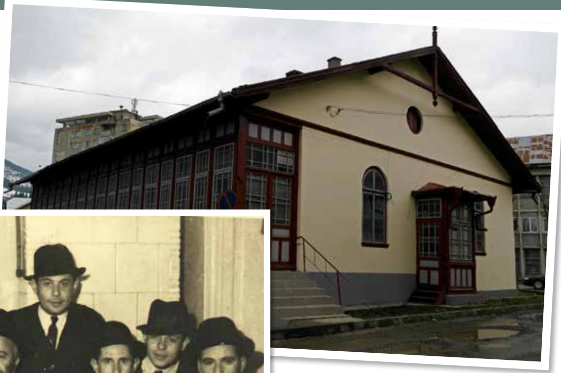
בית הכנסת הישן בו התפלל הרב רובין בקימפולונג, עומד על תילו עד היום