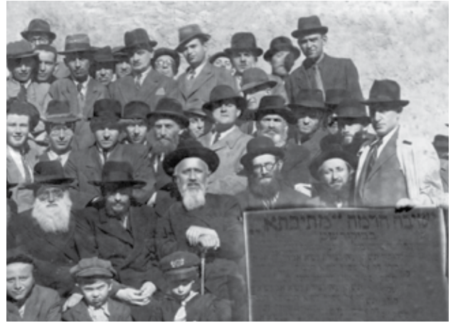
בעיצומה של השואה הקים את 'שיבת מתיבתא' בבוקרשט. לצידו הרב אלכסנדר שפרן רבה של רומניה

לאחר השואה התגורר בארצות הברית ובקנדה במחיצת בניו, ובשנת 1952 יזם מרכז עולמי שיעסוק בסוגיות הרלוונטיות לרבנים הפליטים מאירופה. מרכז זה פעל לעשיית צדק מינימלי עבור הרבנים קורבנות הרדיפה הנאצית, בהבטחת פיצויים כספיים ופנסיה מוגדלת מהממשלה הגרמנית עבורם. המרכז עסק רבות בשליחת חבילות מזון