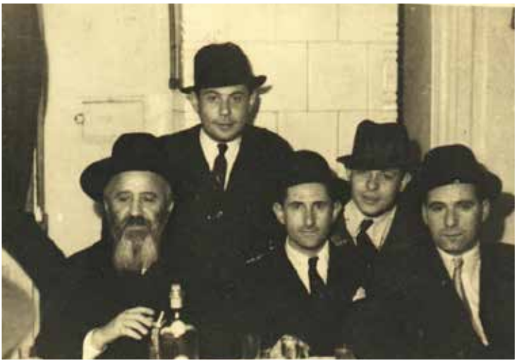
במחיצת תלמידים בבוקרשט בזמן השואה

”כל אידיאולוגיה מחייבת את הדוגלים בה להיות מאוחדים, להתכנס ולאסוף את כוחם כדי להשיג את מטרותיהם, אך בשטח היהודי הדתי מתרחש ההיפך, אגודת ישראל והמזרחי לא מהססים ללחום זה בזה.”