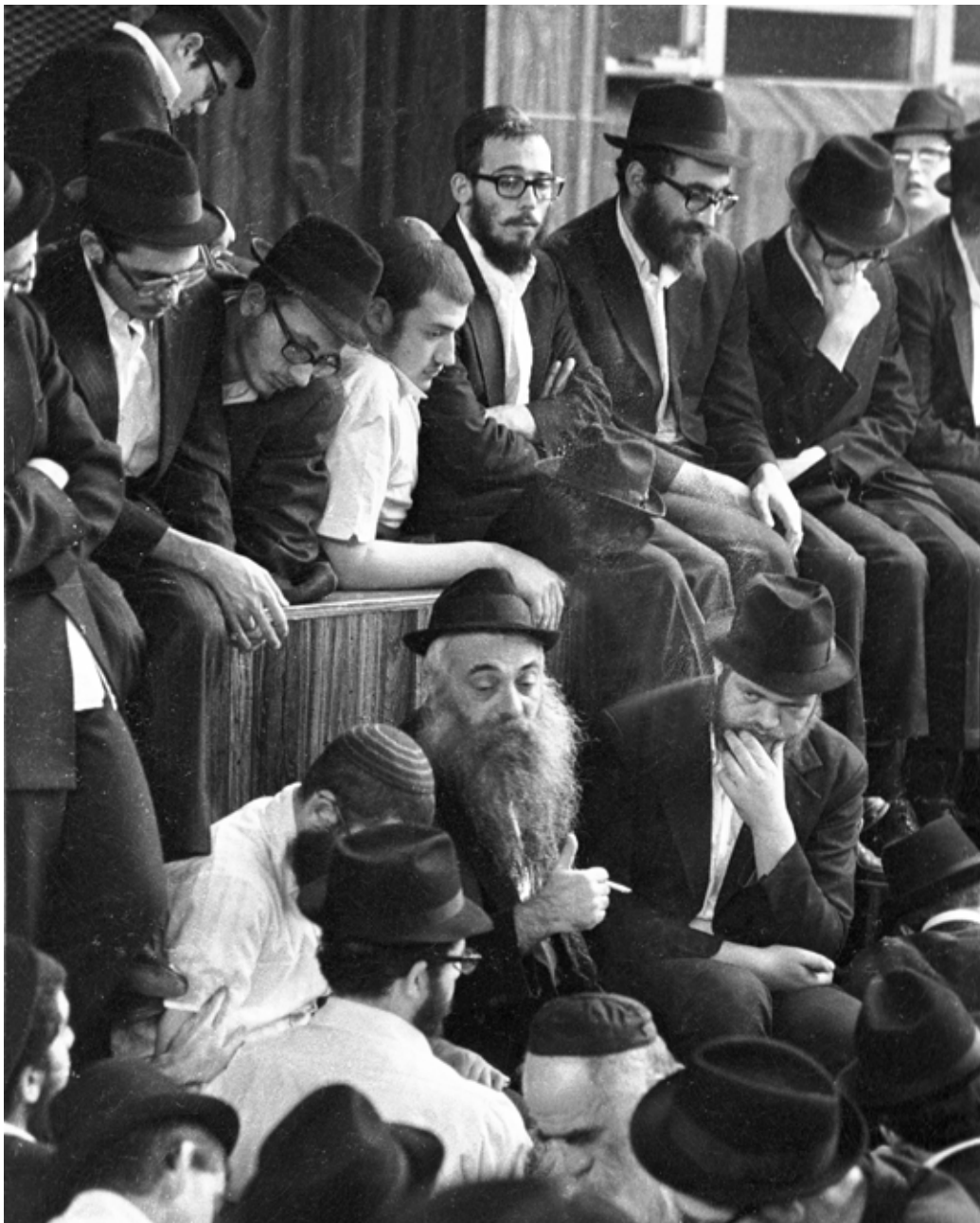
דייק בכל משפט ובכל מילה. ה'חוזר' בפעולה

"בשנים הראשונות הרבי היה מקבל יהודים ל'חידות' שלוש פעמים בשבוע, משעות הערב המוקדמות עד הבוקר. פעם אחת, לאחר ליל 'חידות' ארוך,