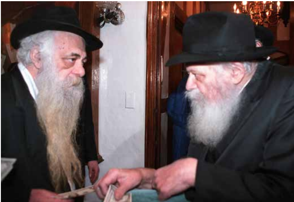
תלמיד מובהק של הרבי. בחלוקת הדולרים

היה טבוע בתוכו. היה מפתיע בכל פעם מחדש לראות עד כמה הדרך הזו שסלל הרבי חדורה בו. ככה הוא הסתכל על הכל".