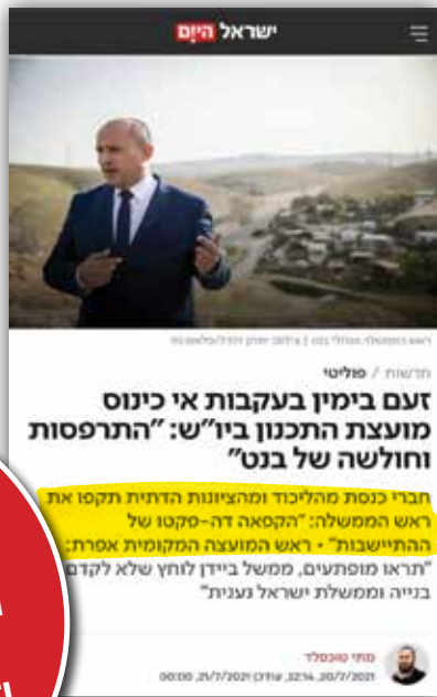
הקפאת ההתיישבות היהודית ביו"ש