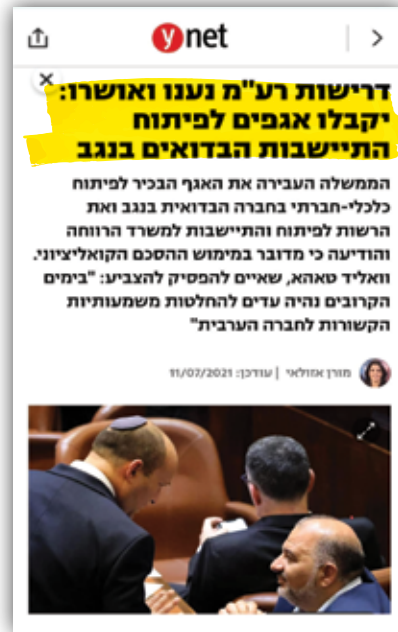
פיתוח 'ההתיישבות' הבדואית בנגב

הזדרזו להתפקד! המתפקדים עד סוף אוגוסט יוכלו לבחור ולהיבחר למרכז הליכוד ולמוסדות התנועה, וזה קריטי להשתלבות במפלגת השלטון