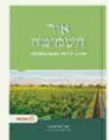
31 ₪ מדריך ידיוטי