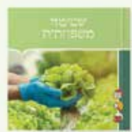
30 ₪ חוברת לימוד משפחתית