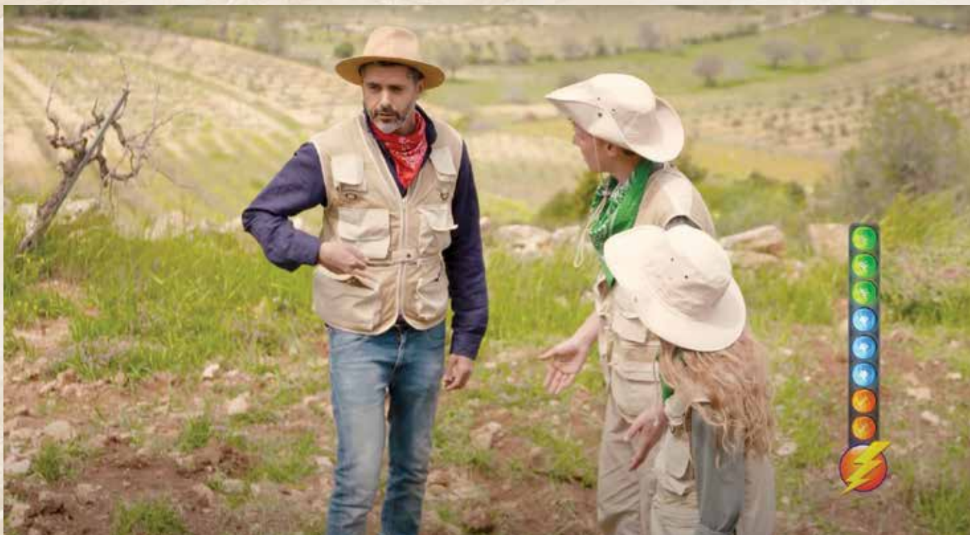
מתוך סדרת הרשת 'רצים למשנה'