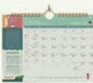
30 ₪ לוח שנה