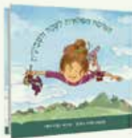
31 ₪ הטיסה הפלאית