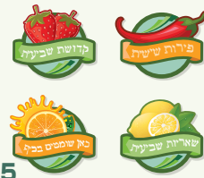
15 ₪ מדבקות למטבח