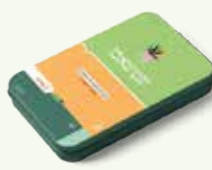
39 ₪ שמיטאבו