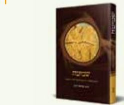
59 ₪ ספר שמיטה של הרב רימון