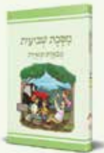
35 ₪ משנאות מסכת שביעית